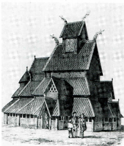
Borgund stavkirke fremstilt i foreningens årbok for 1858.

Kulturminnevernet er avhengig av makten og tyngden som følger med Kulturminneloven og plasseringen under Miljøverndepartementet. Kulturminnevern handler om arealplanlegging, om fysiske objekter og kulturlandskapers eksistens. Vi har erfart at politikere forstår at kulturminner er ikke fornybare ressurser. Kulturminnevernets beste berettigelse er å inngå i et samlet miljøvern. Kulturlivet er av en annen og flyktigere karakter - på en annen måte fornybart. Siden 1980-tallet har underordningen under fylkeskultursjefene vært den største urofaktoren i den regionale forvalt-